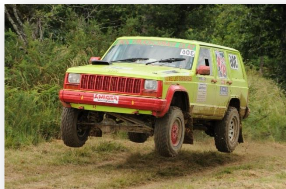
Joël Harichoury s'envole vers sa première victoire dans le Trophée des 4x4