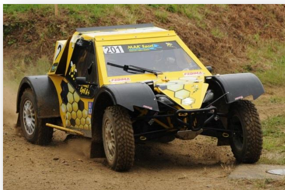
Décidément, Jérôme Hélin est intraitable